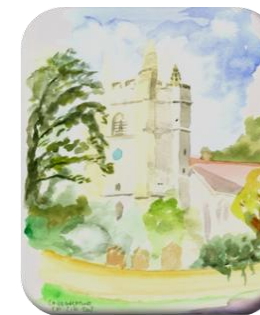
ST MARI PANNY CHIDDINGSTONE