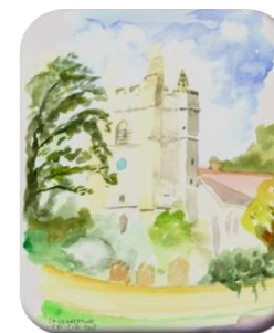
L'ÉGLISE DE SAINTE MARIE CHIDDINGSTONE